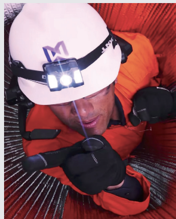
受限空间作业画面共享