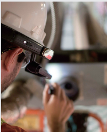
专家操作过程画面共享