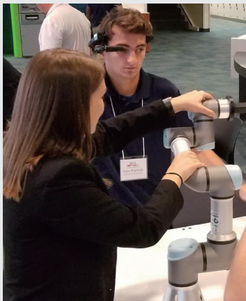
授课 / 培训操作过程画面共享